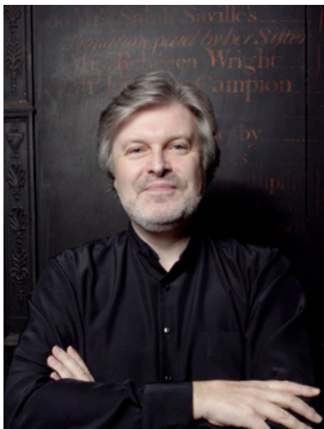
James MacMillan.