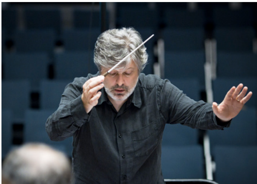
James MacMillan.

SIR JAMES MACMILLAN on üks tänapäeva edukamaid heliloojaid ja esineb rahvusvaheliselt ka dirigendina. Tema muusikaline keel on tulvil mõjutusi ta šoti päritolust, katoliku usust, sotsiaalsest teadlikkusest ja lähedusest keldi rahvamuusikaga. Samuti on sellesse põimitud Kaug-Ida, Skandinaavia ja Ida-Euroopa muusika mõjusid.