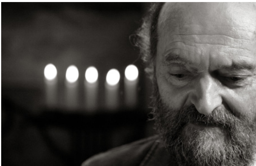
Arvo Pärt.