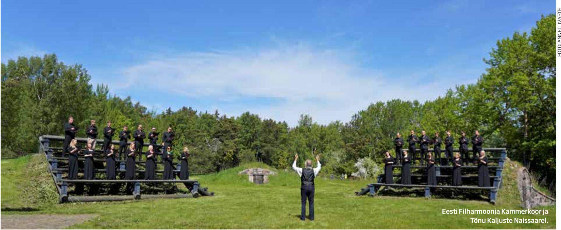
Eesti Filharmoonia Kammerkoor ja Tõnu Kaljuste Naissaarel.