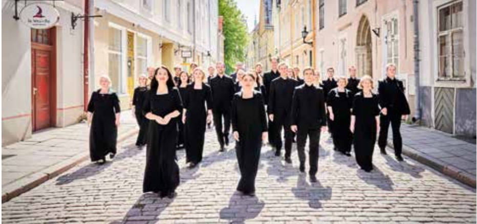
EESTI FILHARMOONIA KAMMERKOOR