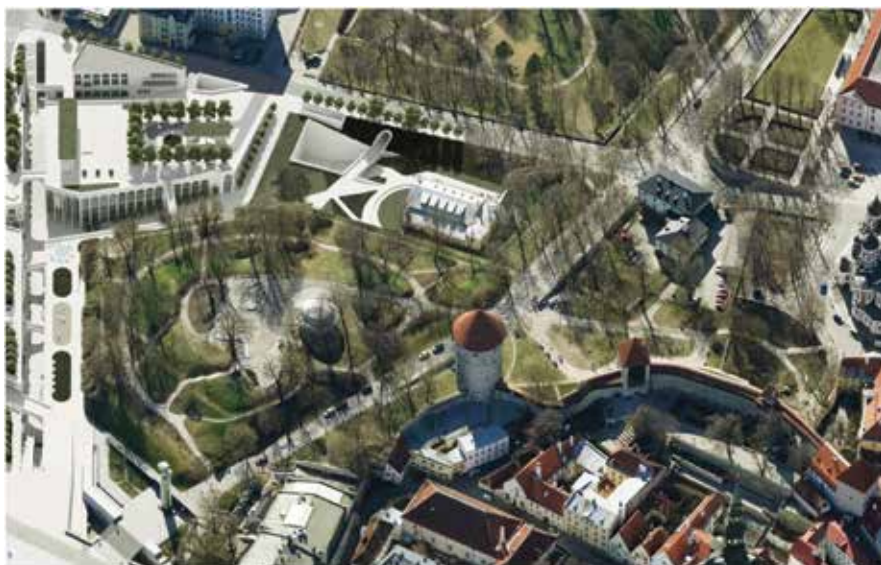
Kontserdimaja kavand Harjuorus. Arhitekt Villem Tomiste.

Seega esitasid ERSO ja EFK riiklikult oluliste kultuuriprojektide nimekirja lisamiseks kontserdimaja ideekavandi, mille nimi oli Helioru Kontserdimaja.