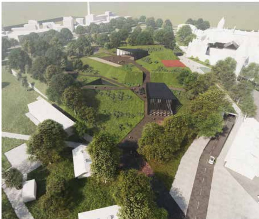
Kontserdimaja kavand Skoone bastionil. Molumba arhitektuuribüroo.

kui Molumba arhitektuuribüroo lahendus Skoone bastionil, olid äärmise põhjalikkusega läbi mõeldud ning tekitasid viljaka arutelu.