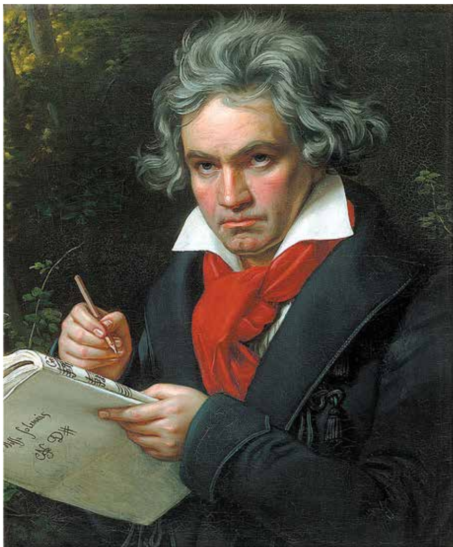
Ludwig van Beethoveni portree. Autor Joseph Karl Stieler, 1820.