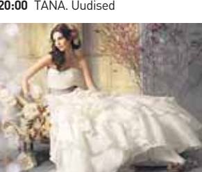
20:30 Venus Naistesaade Venus keskendub esimeses saates puimaleemadale, lütle ja suhtelise.

07:00 Info TV 08:00 TÄNA. Uudised* 08:30 TÄNA +* 08:50 Draamaseriaal. Keelatud armastus. Olse südamesse 142/142* 09:45 Terve tervis* 10:15 TÄNA. Uudised (subtiitritega)* 10:30 Ühistegevuse pooltund* 11:00 Liivakell* 11:45 Käed eemale Mississippist (Saksamaa 2007)* 12:15 Koolitants 2014, 19/19* 13:10 Ameerika eestlased. Idarannik 11/13* 13:40 Kinnisaraveeb 16:15 Meedia keskpunkt* 16:45 Liivakell* 17:00 Kinnisaraveeb 16:25 Terve tervis* 16:45 Liivakell* 17:30 TeTeVeke lastele 18:00 TÄNA. Uudised 18:05 Knopka* 18:35 Nädal Pealinnas 19:00 Suur Paurvere väljaniitus 2014 19:30 TeTeVeke: Loomaaia looduskool