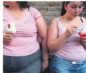
19:30 Terve tervis Tuhustame uut projekti, mis on suunatud ülekaalulistele lastele ja nende vanematele. Opime lundma kristalle, et need enda tervise heaks tööle panevad.

07:00 Info TV 08:00 Nädal +* 08:30 Pühapäevatee* 09:15 Keskikonnadial* 09:45 Need, kes meie kõrval. Vlad Stanisevski* 10:15 Nädal +* 10:45 Arvutitark* 11:15 Kultuurimeeter* 11:45 Ameerika eestlased. Idarannik 11/13* 12:15 Nädal Pealinnas* 12:40 Hõimurühmadok. Mari rahva pulmad* 13:10 Soimaa 2014* 13:40 Kinnisaraveeb 15:00 OTSE: Ülekanne Riigikogust 17:30 TeTeVeke lastele 18:00 TÄNA. Uudised 18:15 Draamaseriaal. Keelatud armastus. Olse südamesse 139/142* 19:00 TÄNA. Uudised