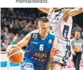
18:55 OTSE: Korpall. Lokomotiv-Kuban vs BC Kalev/Cramo, Uudised

07:00 Info TV 08:00 TÄNA. Uudised* 08:30 TÄNA +* 09:00 Draamaseriaal. Keelatud armastus. Olse südamesse 141/142* 09:45 Meedia keskpunkt* 10:15 TÄNA. Uudised (subtiitritega)* 10:30 LV Pressikonverents* 11:00 Liivakell* 11:45 Kultuurimeeter* 12:15 Koolitants 2014, 19/19* 13:10 Ameerika eestlased. Idarannik 11/13* 13:40 Kinnisaraveeb 16:15 Meedia keskpunkt* 16:45 Liivakell* 17:00 Kinnisaraveeb 16:25 Terve tervis* 16:45 Liivakell* 17:30 TeTeVeke lastele 18:00 TÄNA. Uudised 18:30 Sini-valge lipu all* Tallinna lipp ja Väna–Toomas. Kust on pärit? Pildikesi Liivi sõja eelise Tallinna elu-olust ja mentaliteidist.