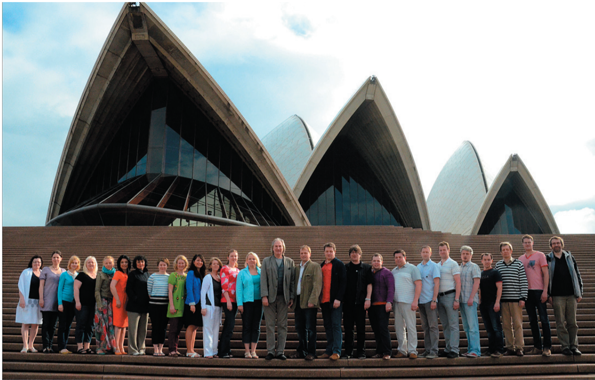
Eesti Filharmonia Kammerkoor Sydneys.

Galakontserdil esitasid Pärdi muusikat lisaks kammerkoorile Sydney Sümfooniaorkestri muusikud. Päev varem toimus kontsert, mis valmis nädala jooksul õpitubade vormis ja kus eesti helilooja teoseid kandis ette Sydney Noorteorkester. „Mul oli põnev õpetada neid noori ja anda neile kogemusi Arvo Pärdi muusika interpreteerimisel. Tema muusika juured ja see, kuidas ta on harjutanud inimesi vaikust kuulama, sajanditevanust tarkust kandvad tekstid – see kõik ongi vallutanud maailma. Mulle dirigendina on alati meeldiv teadmine, et kannan